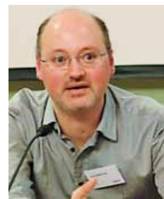
光をもたらした人々: 宣教師と19世紀日本の写真 Bringers of the Light: Western Missionaries and Photography in Nineteenth-Century Japan