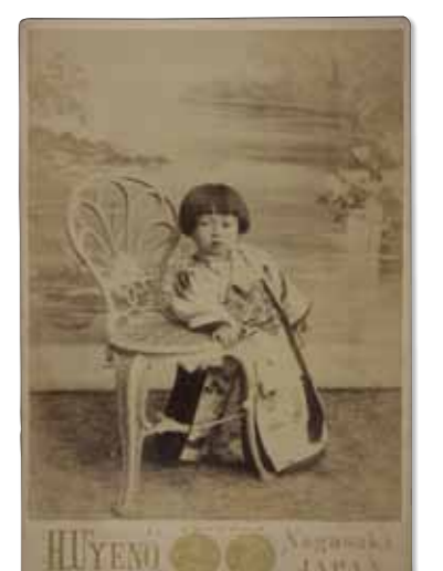
上野彦馬《(上野八重子像)》明治35年頃 ゼラチン・シルバープリント 長崎歴史文化博物館

総合開館20周年記念 夜明けまえ 知られざる日本写真開拓史〈総集編〉 Dawn of Japanese Photography: The Anthology 平成29年3月7日(火)～5月7日(日)