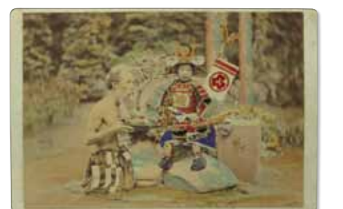
鈴木真一《(子供の武将)》明治時代中期 鶏卵紙に手彩色 後藤新平記念館