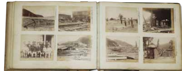
宮内幸太郎《(明治三陸津波写真)『中島待乳写真台帳』より 明治29年 鶏卵紙