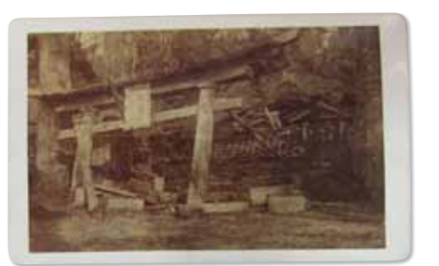
制作者不詳《飛鳥神社矢大臣門崩壊之真景》明治27年 鶏卵紙 本間美術館