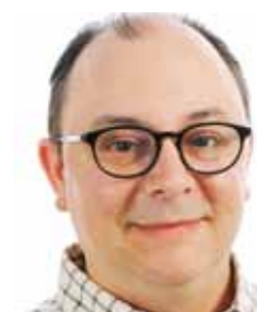
幕末のスイス人写真師: 開港期に関するピエール・ ジョセフ・ロシエの新発見 A Swiss Photographer in Bakumatsu Japan: New Discoveries on Pierre Joseph Rossier, 1859-1860