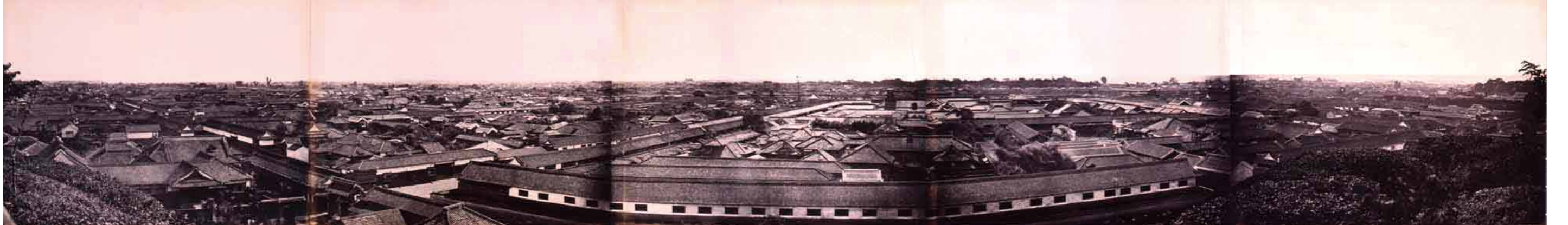
フェリーチェ・ベアト《愛宕山から見た江戸のパノラマ》 文久3～元治元年頃 鶏卵紙4枚構成 東京都写真美術館

◎ 愛宕山からの幕末風景を背景に写真を撮ろう！ 展覧会限定撮影ブースが登場します。